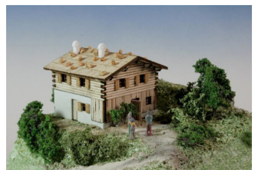
Berghütte Art. 73 318