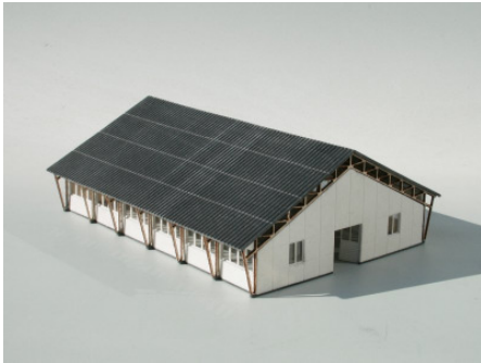
Reithalle Art. 73 297