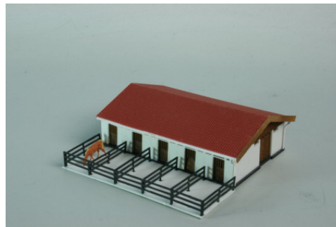
Pferdestallanbau Art. 73 299