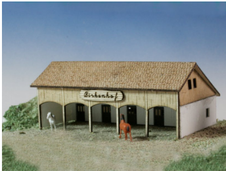
Offener Pferdestall Art. 73 300