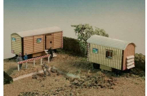
Bauwagen 2 Stück Art. 73 224