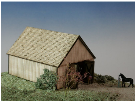
Holzscheune Art. 73 314