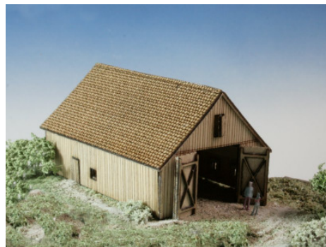
Feldscheune Art. 73 312