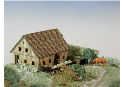
Austragshaus Art. 73 313