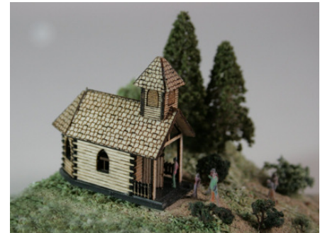
Kapelle Gröbming Art. 73 318