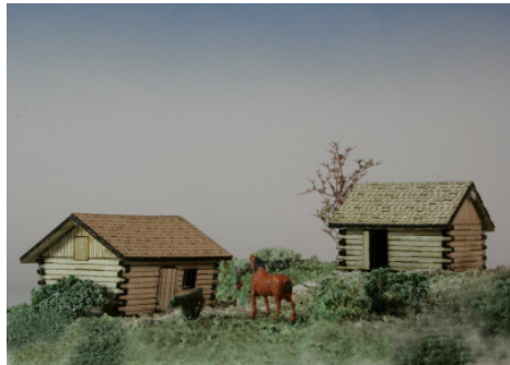
Heustadl 2 Stück Art. 73 316