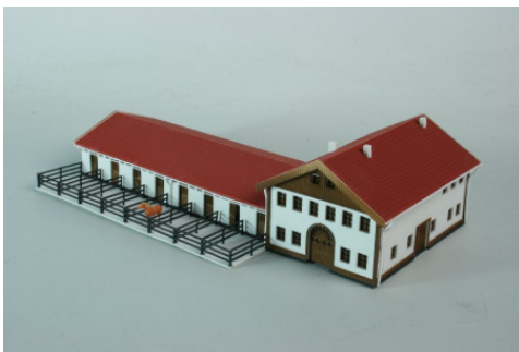
Gutshof und Pferdestall Art. 73 298