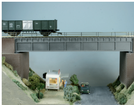
46 605 Unterzug Blechträgerbrücke

Das verwendete Polystyrol ist durchgefärbt, UV- stabilisiert und wetterfest. Das Material wird präzise cnc-gefräst. Ergänzt werden die Bausätze durch wasserfest verleimtes Birken-sperrholz. Dieses Material wird cnc-gelasert.