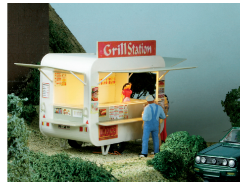
43 341 Imbisswagen - 97x64x76 mm (LxBxH)