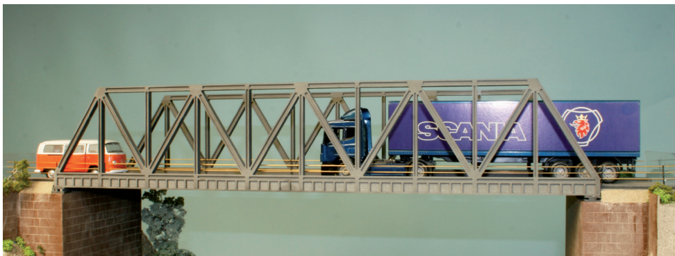
46 652 Gitterträger Straßenbrücke 616 mm - 616 x 180 x 118 mm (LxBxH) - Polystyrol

aus Kunststoff und Sperrholz - wetterfest und durchgefärbt