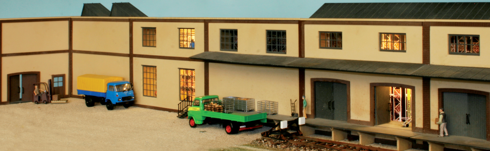
Fabrikmodule 43 356 bis 43 363 - Halbreief - 223 x 60 x 178 mm (LxBxH) - Polystyrol

aus Kunststoff und Sperrholz - wetterfest und durchgefärbt