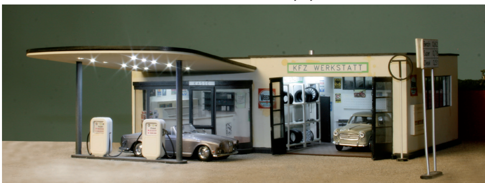
43 240 Tankstelle - 350 x 205 x 100 mm (LxBxH) - Polystyrol