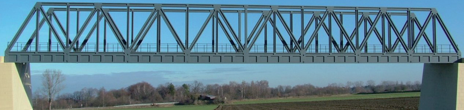
26 608 Gitterträgerbrücke, lang - 1943 x 218 x 242 mm (LxBxH) - Polystyrol

Modellbausätze aus Kunststoff, Messing und Sperrholz - wetterfest und durchgefärbt