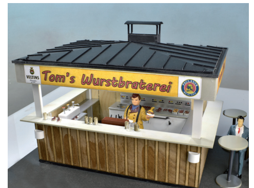
23 331 Imbissbude