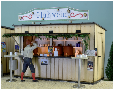
23 338 Glühweinstand

Das verwendete Polystyrol ist durchgefärbt, UV- stabilisiert und wetterfest. Das Material wird präzise cnc-gefräst. Ergänzt werden die Bausätze durch wasserfest verleimtes Birken-sperrholz. Dieses Material wird cnc-gelasert.