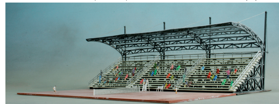
63 330 Center Court Tennisplatz komplett - 254 x 313 x 97 mm (LxBxH) - Polystyrol