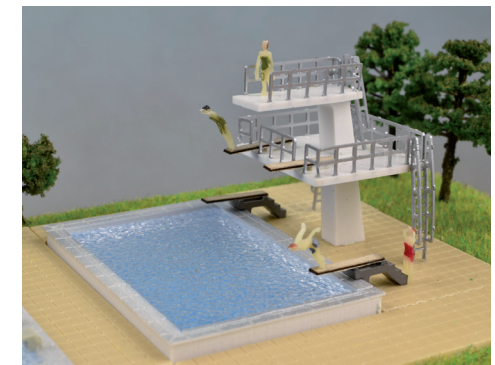
61 431 Sprungturm mit Becken