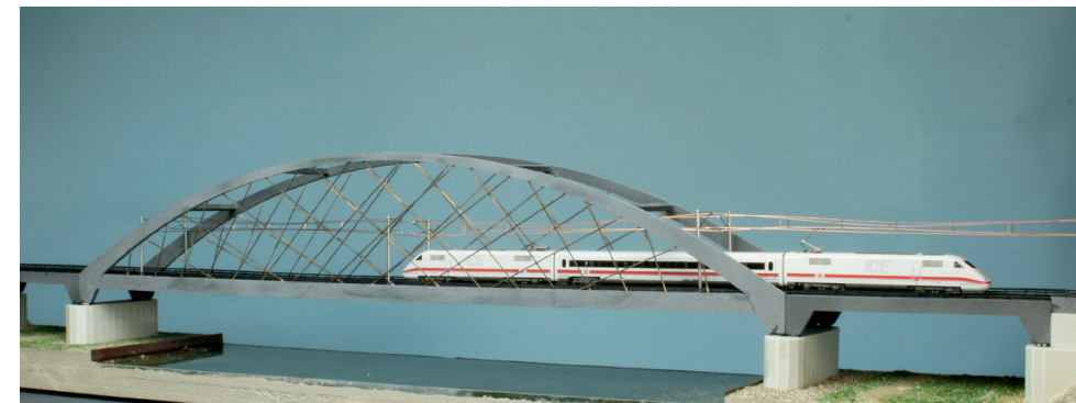
66 641 Netzwerkbogenbrücke und 66 644 Vorfluterbrücke - Polystyrol und Messing

Modellbausätze aus Kunststoff, Messing und Sperrholz - wetterfest und durchgefärbt