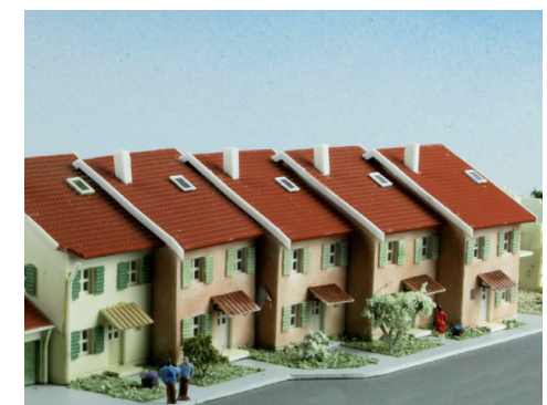
63 257 Reihenmittelhaus - 3Stück