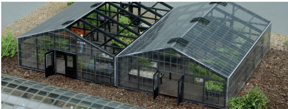
13 216 Gewächshaus klein - 105 x 75 x 35 mm (LxBxH) - Polystyrol und Lexan

aus Kunststoff und Sperrholz - wetterfest und durchgefärbt