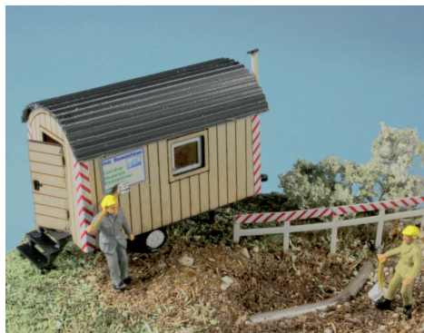
Detail Bauwagen einachsrig

Das verwendete Polystyrol ist durchgefärbt, UV- stabilisiert und wetterfest. Das Material wird präzise cnc-gefräst. Ergänzt werden die Bausätze durch wasserfest verleimtes Birken-sperrholz. Dieses Material wird cnc-gelasert.