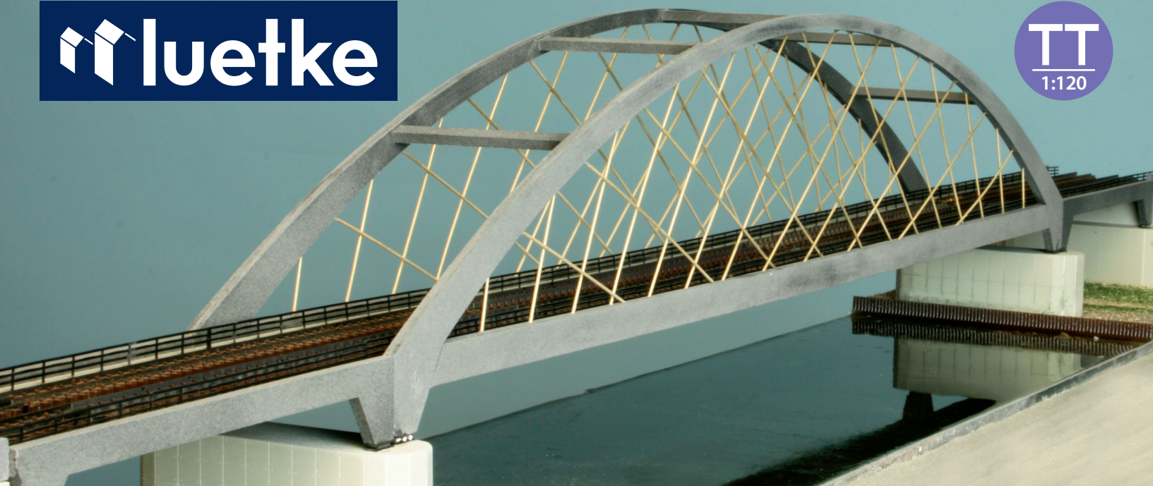
16 640 Netzwerkbogenbrücke - 776 x 97 x 154 mm (LxBxH) 16 644 Vorfluterbrücke - 204 x 97 x 31 mm (LxBxH)

aus Kunststoff und Sperrholz - wetterfest und durchgefärbt